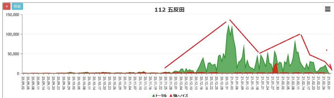
五反田 90日間データ